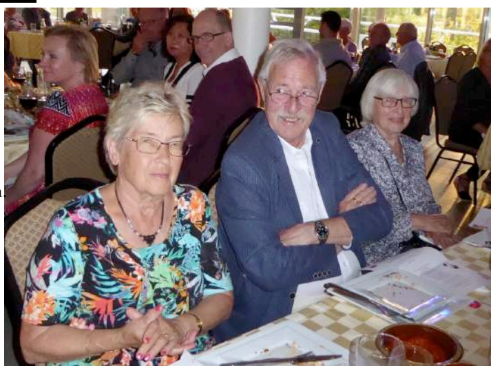
Isakssons konverserar sina bordsgrannar.