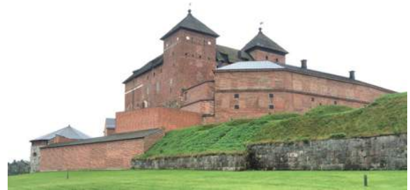
Tavastehus slott 2015 ( www.slottsguiden.info )