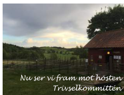
Nu ser vi fram mot hösten Trivselkommittén

Gå också med i Facebook-gruppen Akalladalens Samfällighet - där kan man få och växla mycket information. Kontakta Nyree Ruiz.